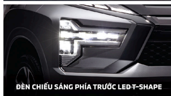
ĐÈN CHIẾU SÁNG PHÍA TRƯỚC LED-T-SHAPE

Triết lý "Vẻ đẹp từ công năng" kết hợp lưới tản nhiệt với ốp cản trước thiết kế hiện đại giúp nổi bật sự sang trọng theo phong cách Crossover.