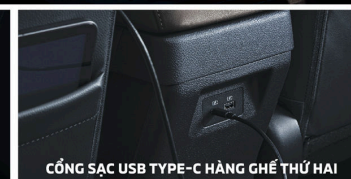
CỔNG SẠC USB TYPE-C HÀNG GHẾ THỨ HAI