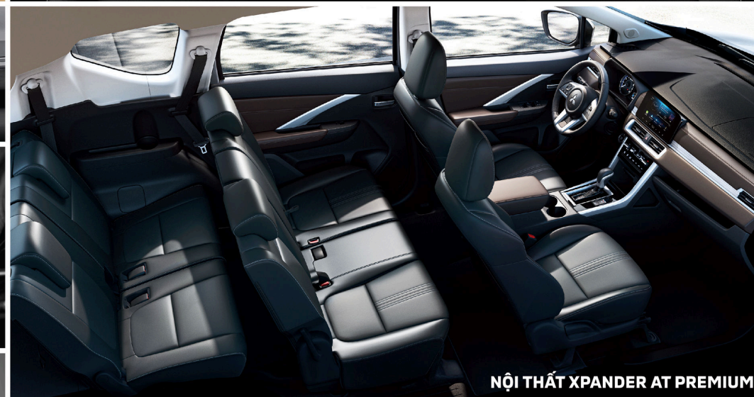
NỘI THẤT XPANDER AT PREMIUM

Khoang nội thất sang trọng với trang bị cao cấp kết hợp với vật liệu mềm cho cảm giác tinh tế và thoải mái.