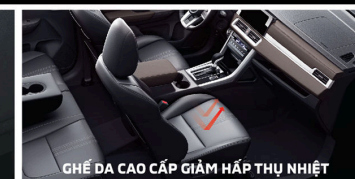
GHẾ DA CAO CẤP GIẢM HẤP THỤ NHIỆT