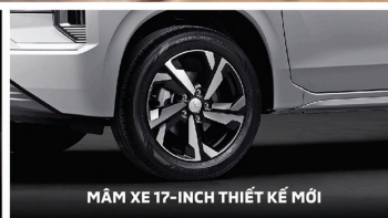
MÃM XE 17-INCH THIẾT KẾ MỚI