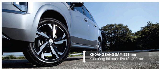
KHOẢNG SÁNG GẮM 225mm Khả năng lội nước lên tới 400mm