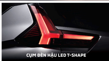
CỤM ĐÈN HẬU LED T-SHAPE