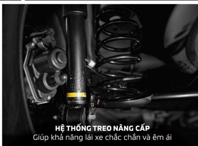
HỆ THỐNG TREO NÂNG CẤP Giúp khả năng lái xe chắc chắn và êm ái