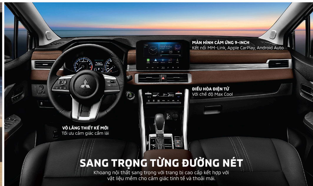
MÀN HÌNH CẢM ỨNG 9-INCH Kết nối MM-Link, Apple CarPlay, Android Auto

Khung xe toàn cầu của Mitsubishi mang đến khả năng bảo vệ an toàn cao nhất cho người lái và hành khách.