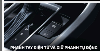
PHANH TAY ĐIỆN TỬ VÀ GIỮ PHANH TỰ ĐỘNG