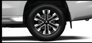
MẪM BÁNH XE HỢP KIM 18 INCH HAI TÔNG MÀU Thiết kế mới nổi bật hơn, mạnh mẽ hơn.