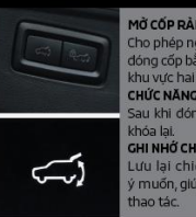
MỞ CỐP RÀNH TAY