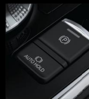
PHANH TAY ĐIỆN TỰ ĐỘNG