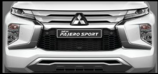
THIẾT KẾ LƯỚI TẢN NHIỆT MỚI VIÊN MẠ BẠC Tăng thêm vẻ lịch lãm và mạnh mẽ.