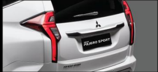
ĐÈN HẬU DẠNG LED THIẾT KẾ MỚI Hiện đại và tối ưu cho khả năng nhận biết từ phía sau.