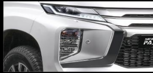
ĐÈN XE HIỆN ĐẠI Cụm đèn LED thiết kế mới, tích hợp công nghệ và trang bị hiện đại với đèn chiếu góc hỗ trợ chiếu sáng tốt hơn khi xe vào cua, giúp điều khiển xe dễ dàng và an toàn hơn.