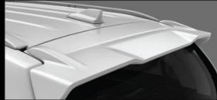
CẢNH LƯỚT GIÓ THỂ THAO VÀ ĂNG-TEN VÂY CÁP Trang bị tiêu chuẩn, mang đến sự cá tính và hiện đại.