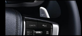
LẦY CHUYỂN SỐ TRÊN VỎ LĂNG