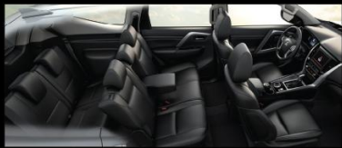
KHÔNG GIAN 7 CHỖ RỘNG RÃI VỚI NỘI THẤT BỌC DA CAO CẤP GHẾ LÁI VÀ GHẾ HÀNH KHÁCH PHÍA TRƯỚC CHÍNH ĐIỆN 8 HƯỚNG TIỆN NGHI*