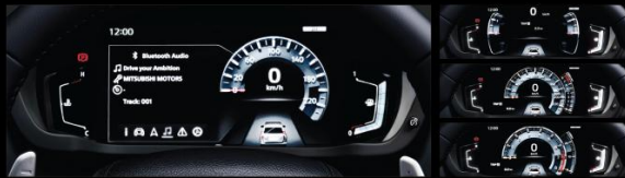
ĐỒNG HỒ KỸ THUẬT SỐ HIỆN ĐẠI Cụm đồng hồ kỹ thuật số với màn hình LCD kích thước lớn 8-inch hiện đại giúp người lái dễ quan sát các thông tin hiển thị cũng như cho phép khả năng tùy chỉnh các dạng hiển thị khác nhau tùy theo nhu cầu và sở thích của người dùng.