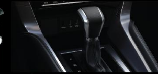
HỘP SỐ TỰ ĐỘNG 8 CẤP VỚI CHẾ ĐỘ THỂ THAO SPORT MODE Chế độ thể thao giúp sang số linh hoạt.