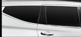
KÍNH CỬA TỐI MÀU* Kính cửa sau và kính phía sau tối màu tăng thêm vẻ sang trọng.